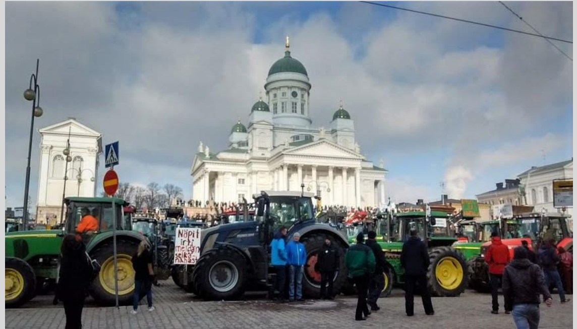
Kuva: Pinja Sipari